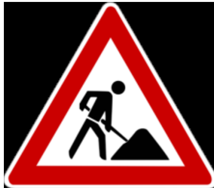
Jinsi Mfano wa E4 Unavyofanya

Mfano wa E4 umetengenezwa kusaidia wote wanaovutiwa na Uwezeshaji na ambao wana upatikanaji mdogo wa fedha, kufundisha na kujifunza fursa, uzoefu wa kazi na shughuli za mafunzo. Mtumiaji E4 aliyejitolea atakuwa na uwezo wa kuendeleza msingi wa ujuzi, kufuata fursa, kupitia shamba la fursa, eneo la InternZone na uzoefu wa kazi. Wale wanaopenda katika kuanza kwa biashara watapata pia vifaa vya msaada na wanaweza kutumia mbinu ya Enterprise 360 kama ilivyoandaliwa na timu ya E4. Mfano wa E4 ni mchakato wa hatua 12, kufuata hatua kwa makini. Safari ya E4 ya mtumiaji imeonyeshwa hapa chini